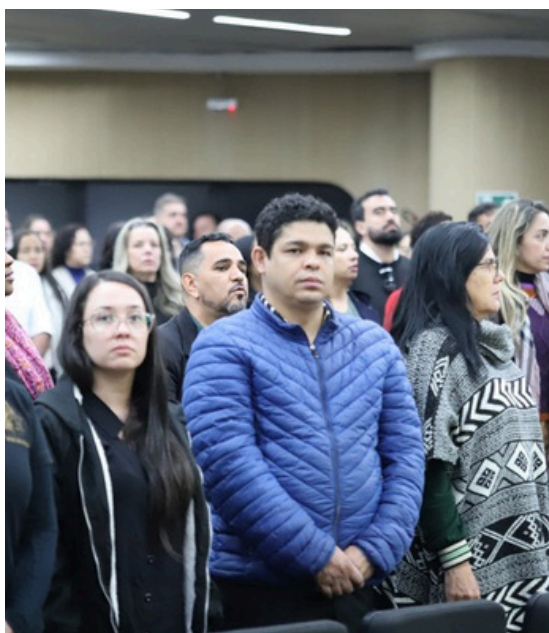
■ O público.

A íntegra do Seminário Estadual de Capacitação está disponível no canal do TCE-MG no YouTube . ■