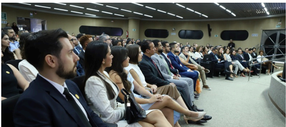
Os servidores empossados.