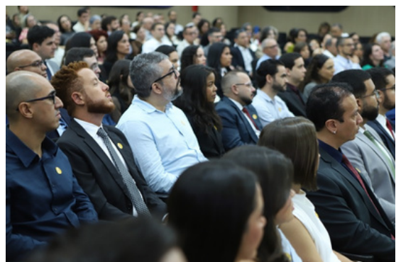
Os servidores empossados.