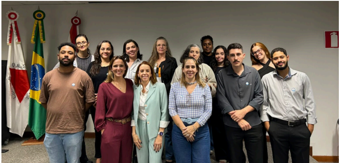
Os estudantes do curso de Direito do Centro Universitário Unihorizontes.