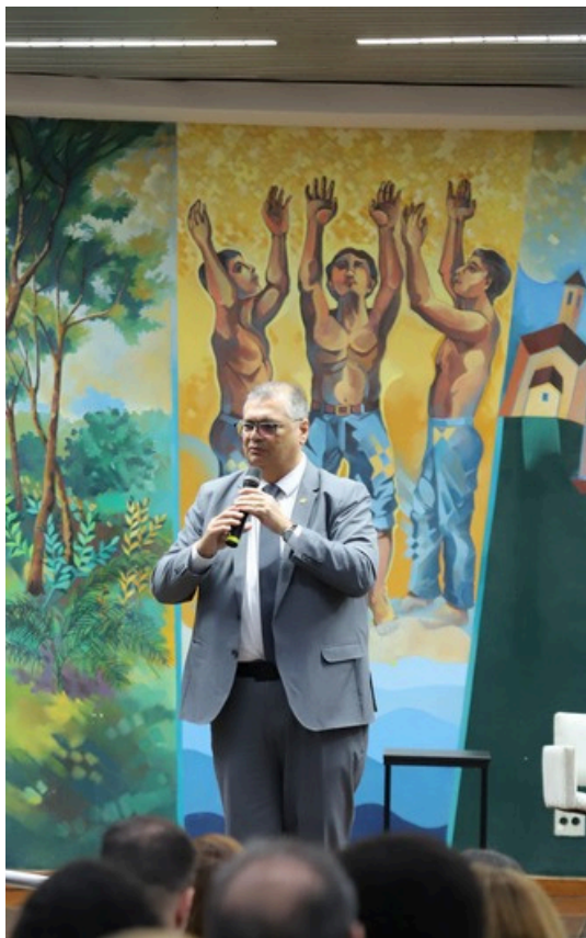
O Ministro do STF Flávio Dino.

Ao final do fórum, foi lançada a Carta de Propósitos Sustentáveis do TCE-MG, documento que reunirá compromissos e diretrizes voltados à promoção de ações ambientais e institucionais sustentáveis no âmbito da Corte de Contas. ■