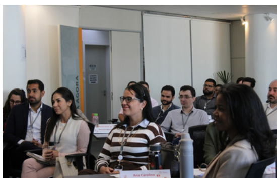
Os novos servidores, participantes da palestra.

O encerramento foi dedicado à apresentação de casos paradigmáticos extraídos da experiência do MPC-MG perante a Corte de Contas. As situações exemplificadas permitiram aos ingressantes visualizar, em perspectiva prática, como a intervenção ministerial colabora para a identificação e prevenção de irregularidades, o aperfeiçoamento da governança pública e a ampliação da efetividade das políticas voltadas à população.