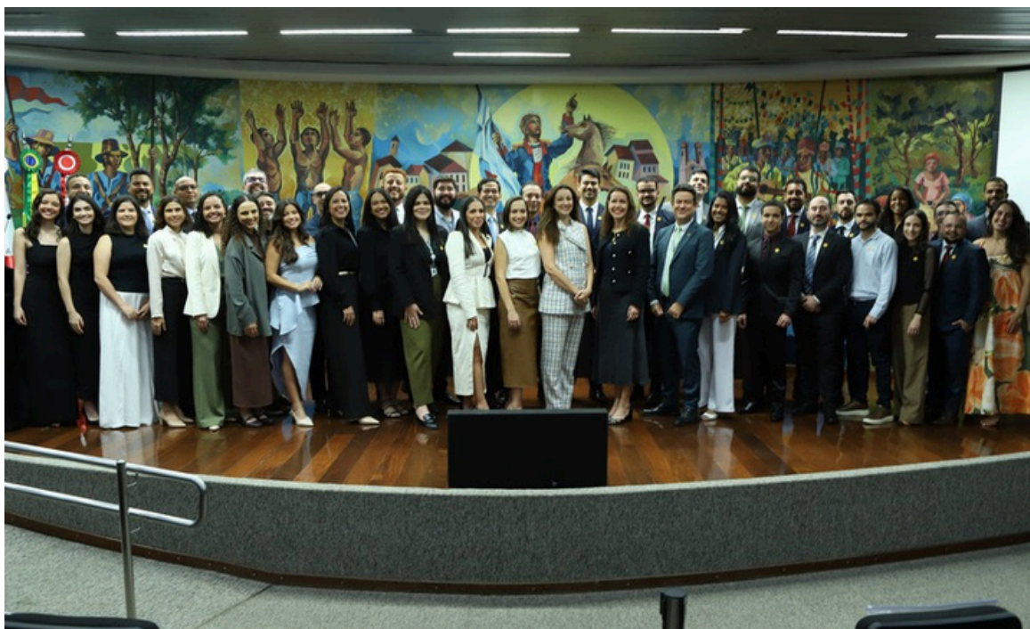
Os servidores empossados.