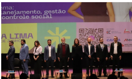
O dispositivo de honra da cerimônia.