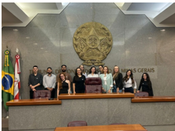
Discentes do Centro Universitário visitam o Plenário do TCE-MG. Acervo pessoal.

da Primeira e da Segunda Câmaras. No local, os alunos puderam assimilar como funciona a atividade plenária do Tribunal de Contas e compreender aspectos práticos do processo de controle e fiscalização exercido pelos órgãos de controle externo.