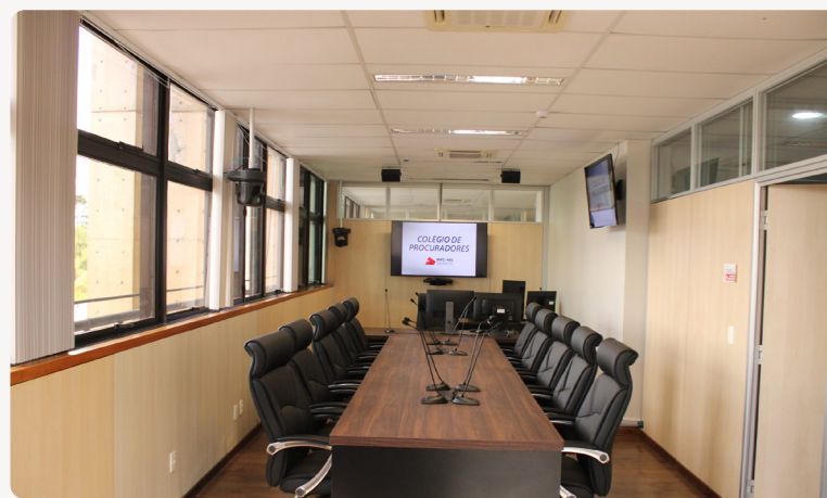
O plenário.