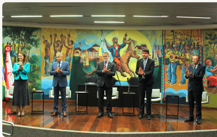
O dispositivo de honra do evento.