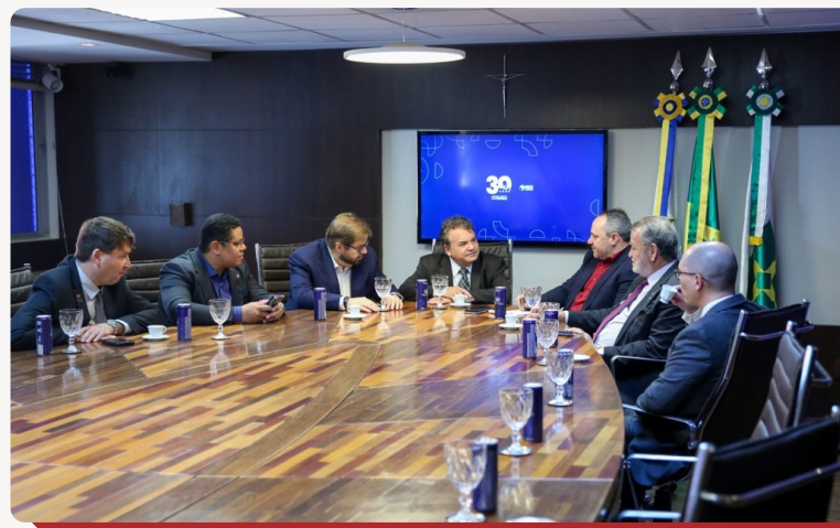
A reunião.