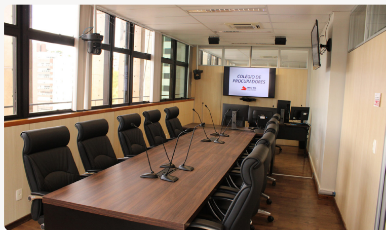
O plenário.