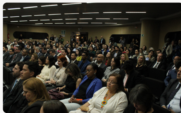
O público.