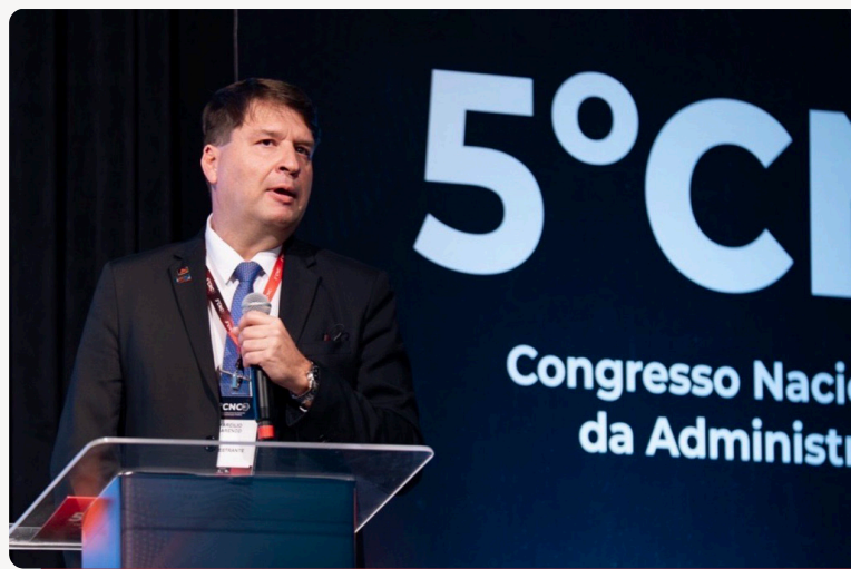
O Procurador-Geral do MPC-MG e Presidente da Ampcon, Marcílio Barenco, durante sua palestra.

Marcílio Barenco também destacou que o processo estrutural exige mudança de perspectiva no controle externo, com foco não apenas na responsabilização, mas na efetividade das políticas públicas e na concretização de direitos fundamentais. ■