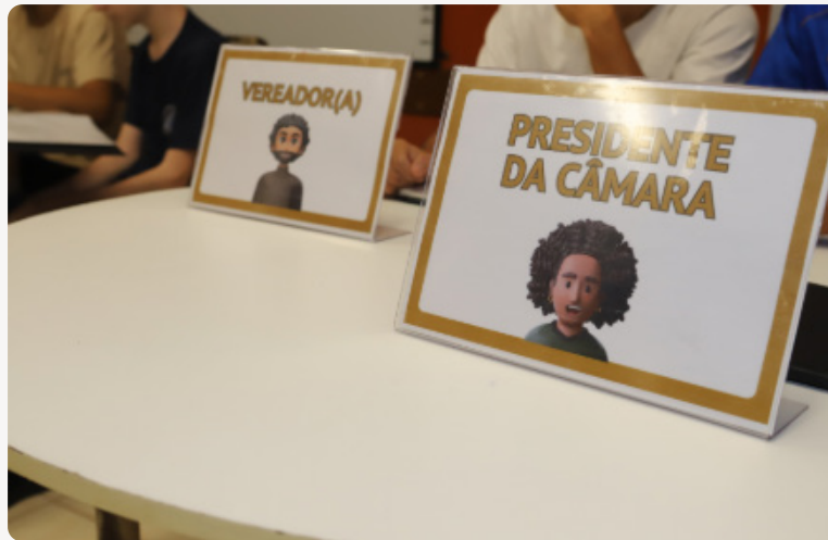
Placas com cargos fictícios do Jogo do Tributo.