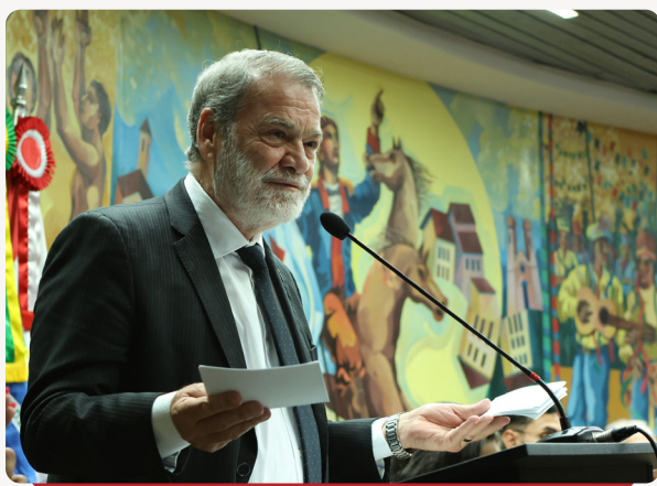
O Presidente do TCE-MG, Conselheiro Durval Ângelo, durante sua fala.

Também houve a entrega simbólica de mais de 2,5 mil obras literárias à Fraternidade Brasileira de Assistência aos Condenados (FBAC), re-