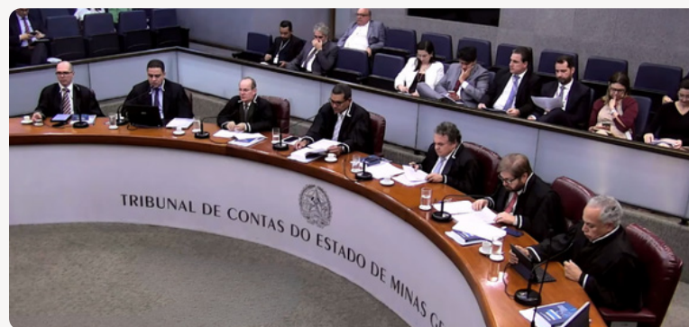
O colegiado do TCE-MG.