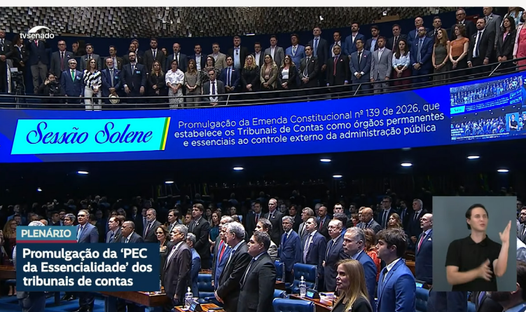
O evento durante a execução do Hino Nacional.