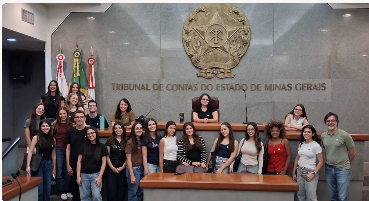
Os estudantes participantes durante a visita ao Plenário do TCE-MG.