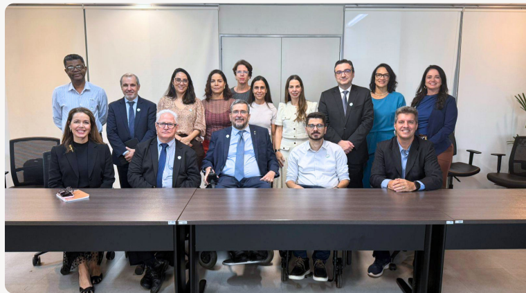
Reunião do Comitê de Acessibilidade e Inclusão do IRB.