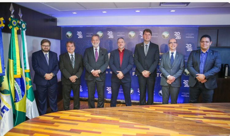
Autoridades participam de reunião com a Unale.

reforçou o diálogo entre as entidades em torno do fortalecimento do controle externo e da cooperação entre os órgãos públicos. ■