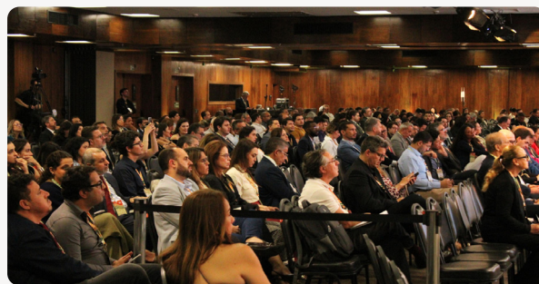
O público.