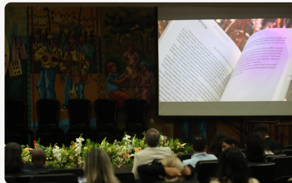
O público presente.