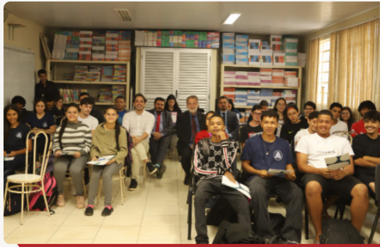
Estudantes aprendem sobre o funcionamento estatal com o Jogo do Tributo.