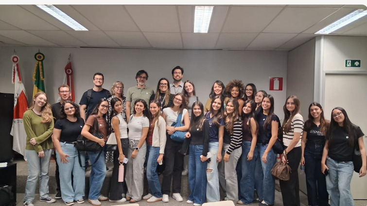
Os estudantes participantes. Acervo pessoal.

No dia 5, o Ministério Público de Contas do Estado de Minas Gerais promoveu mais uma edição do projeto institucional Conhecendo o MPC, no auditório Simão Pedro Toledo, na sede do Tribunal de Contas.