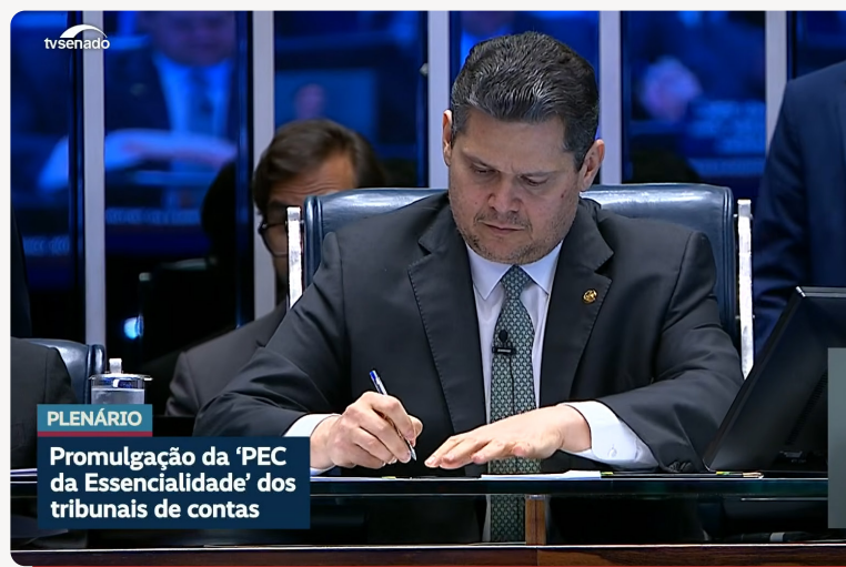
Davi Alcolumbre assina a norma.