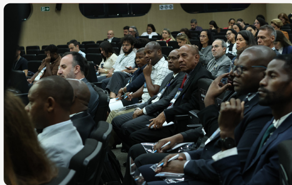
O público presente.

Criado em 2003, o Bibliocontas consolidou-se como uma rede nacional de cooperação entre bibliotecários, arquivistas, museólogos e profissionais que atuam em unidades de informação dos Tribunais de Contas brasileiros. ■