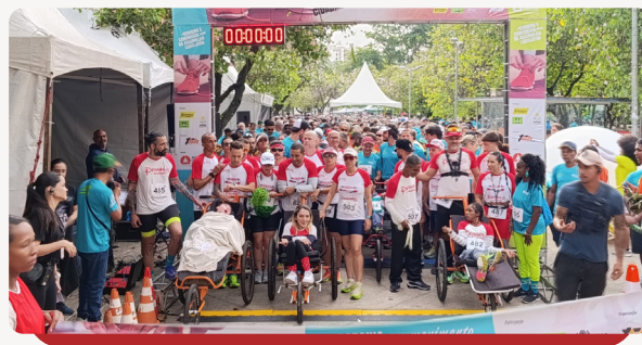
A largada.