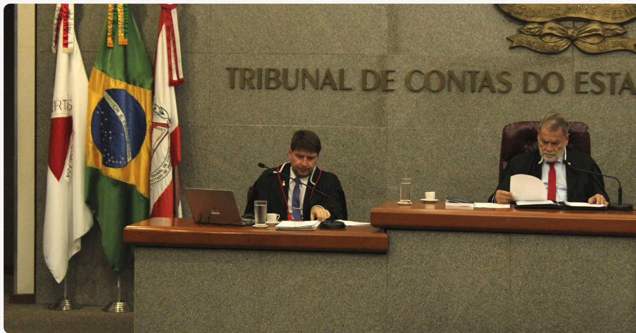
A Sessão Plenária.

institucional, à defesa do controle externo e à produção acadêmica voltada à efetividade das políticas públicas.