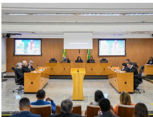
Reprodução TCE-SE.