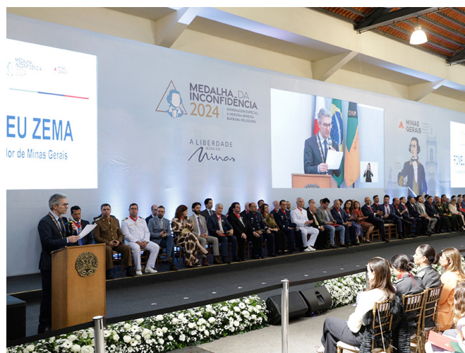
O Governador do Estado de Minas Gerais, Romeu Zema, ao púlpito.

A entrega da Medalha da Inconfidência não apenas reconhece os feitos de indivíduos notáveis, mas também reafirma o compromisso do Estado de Minas Gerais com a preservação de sua história e o reconhecimento daqueles que contribuem para o seu desenvolvimento e progresso. ■