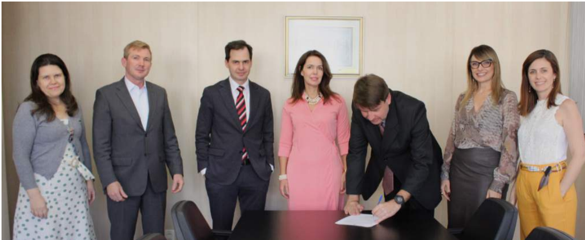
Os Membros do Colégio de Procuradores.