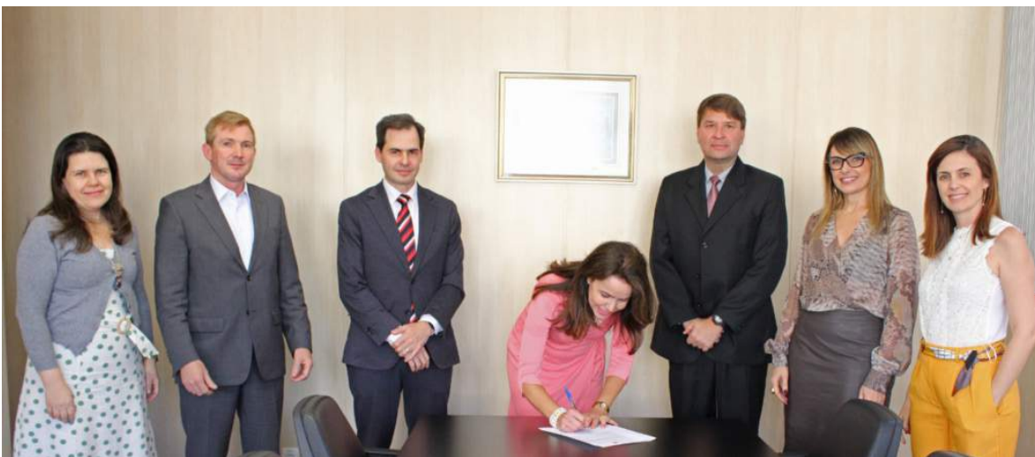
Os Membros do Colégio de Procuradores.