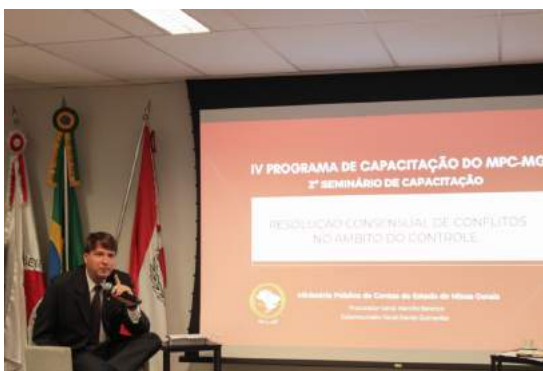
O Procurador-Geral, Márcio Barenco, em sua fala de encerramento. 23 nov. 2023.