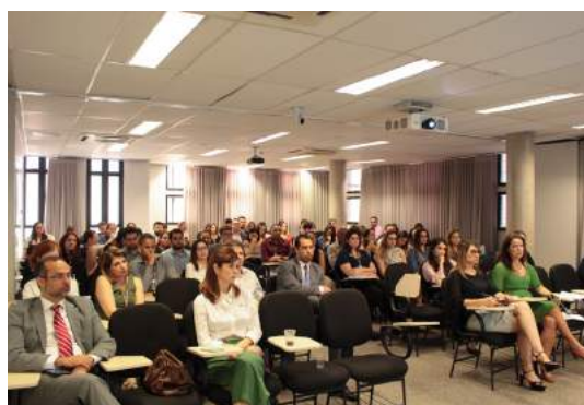
Os participantes da palestra. 23 nov. 2023.