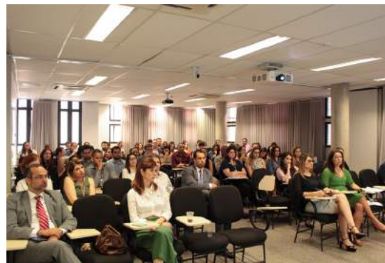
Os participantes da palestra. 23 nov. 2023.