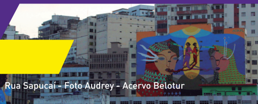
Rua Sapucaí

O incrível pôr do sol da Sapucaí é hoje um dos mais belos horizontes da capital, de onde se veem os prédios do Centro, a Serra do Curral, o imenso verde do Parque Municipal, o Viaduto de Santa Tereza e as obras do primeiro mirante de arte urbana do mundo. Em dezembro de 2018, a Prefeitura de Belo Horizonte, por meio da Belotur, instalou duas lunetas na via, que permitem um “zoom” na arquitetura e no skyline em constante transformação.