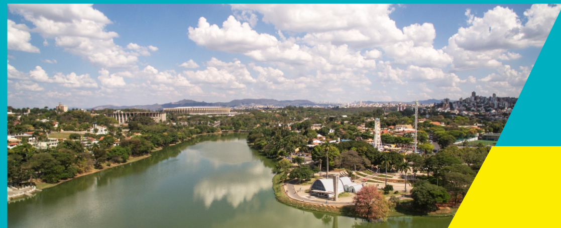
Vista aérea Pampulha

Compõem o roteiro os edifícios e jardins da Igreja São Francisco de Assis, o Museu de Arte da Pampulha, a Casa do Baile e o Iate Tênis Clube, construídos quase simultaneamente entre 1942 e 1943, além do espelho d'água e da orla da Lagoa. As Praças Dino Barbieri e Alberto Dalva Simão, ambas projetadas por Burtle Marx, completam o Conjunto Moderno.