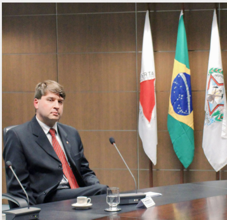
O Procurador-Geral do MPC-MG, Marcílio Barenco, 30 mai. 2022.

INTEGRIDADE - TRANSPARÊNCIA - EFETIVIDADE