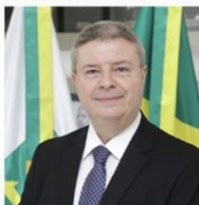
MINISTRO ANTONIO ANASTASIA