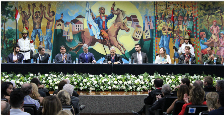
A mesa de honra da solenidade. 15 fev. 2023.