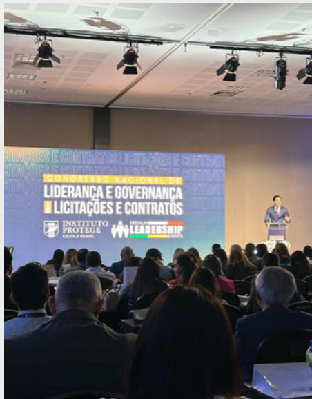
Participantes em uma das palestras do evento. 7 fev. 2023.

Terminou no dia 9 deste mês, em Brasília, o Congresso Nacional de Liderança e Governança em Licitações e Contratos, realizado no Centro Internacional de Convenções do Brasil.