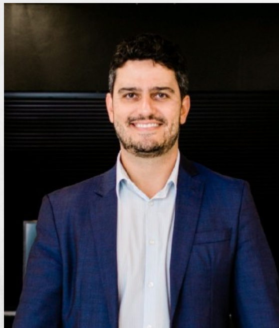
O Controlador-Geral do Estado, Rodrigo Fontenelle de Araújo Miranda.