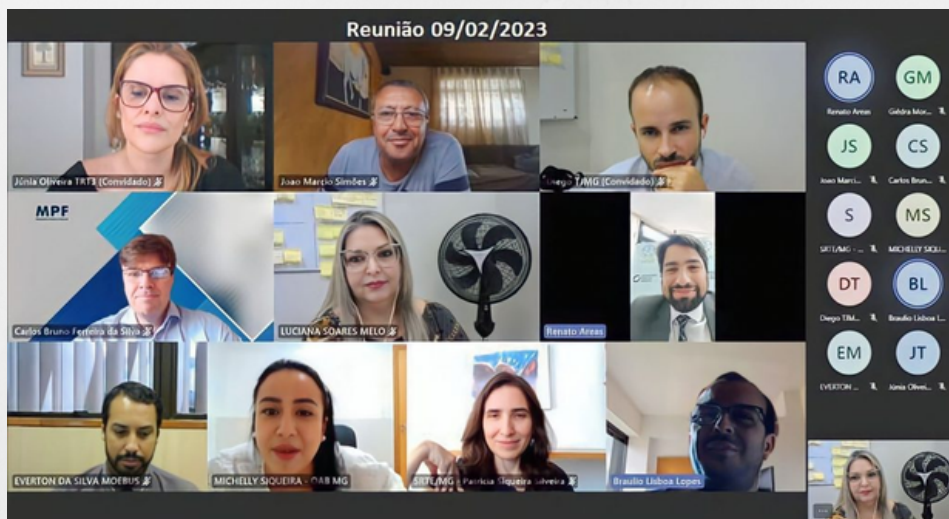
Participantes da reunião. 9 fev. 2023.