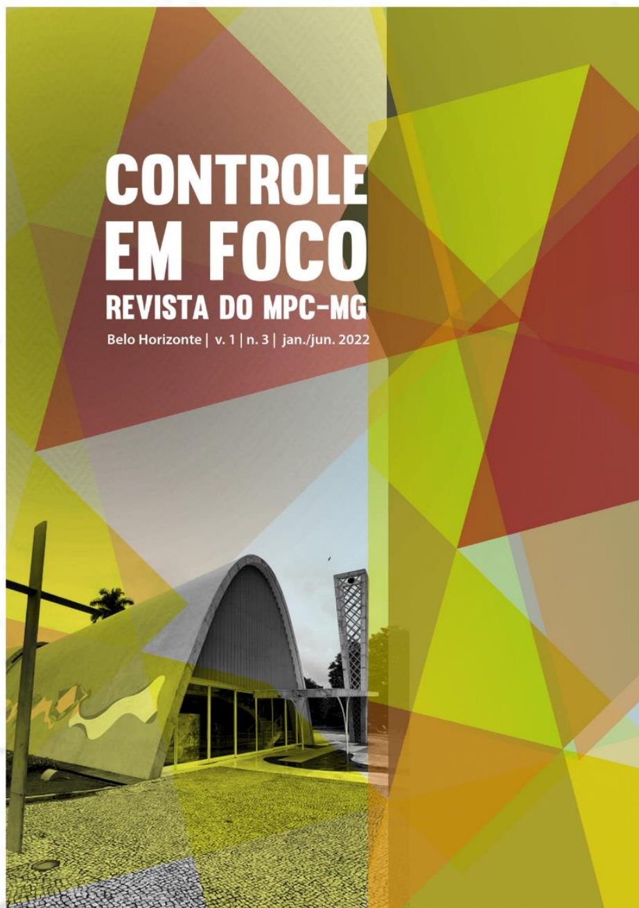
Capa da Revista "Controle em Foco" - 3ª edição

O Ministério Público de Contas do Estado de Minas Gerais (MPC-MG) lançou, no dia 30 de maio, a terceira edição da Revista "Controle em Foco", periódico semestral da instituição. A publicação corresponde ao primeiro semestre deste ano.