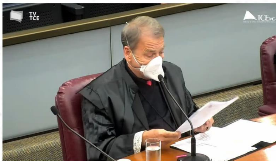
Conselheiro-Corregedor Durval Ângelo. Sessão do Pleno. 15 jun 2022.

entação para permear as ações do Tribunal de Contas. Pontuou que as ações do Ministério Público de Contas devem se pautar para evitar lesão ao erário e afastar – preventivamente – qualquer situação que acarrete ilegitimidade de despesas públicas, sobretudo naqueles municípios em que se verifique deficiência financeira para honrar compromissos legais e contratuais, seja por crise econômica seja por crise sanitária.