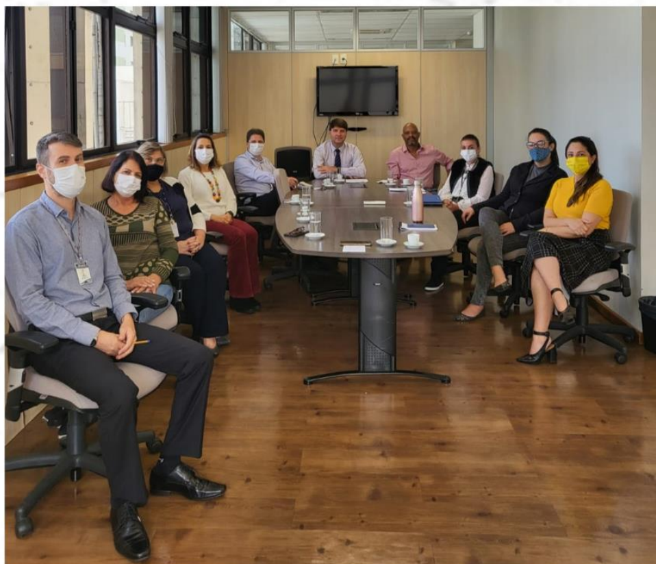
O Procurador-Geral Marcílio Barenco e a equipe da Caop. 09 jun. 2022.

A reunião objetivou a apresentação da nova metodologia de trabalho, além de exposição de ideias acerca de seu funcionamento, como no caso da Camp. O novo modelo visa dar melhor tratamento aos processos que chegam ao Ministério Público de Contas a fim de otimizar os serviços.